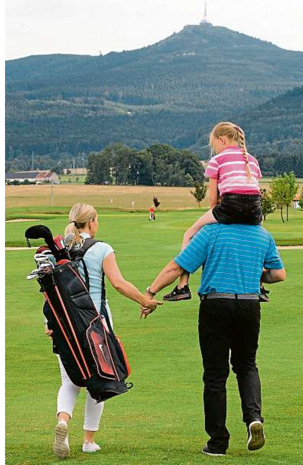
Foto v příloze a grafika na obálce: Zdeněk Sluka, Ladislav Adámek, archiv ČGF

Před 14 lety vznikla Nadace Hanuše Goldscheidera s cílem podporovat český golf a jeho rozvoj, zejména se zaměřením na děti a mládež.