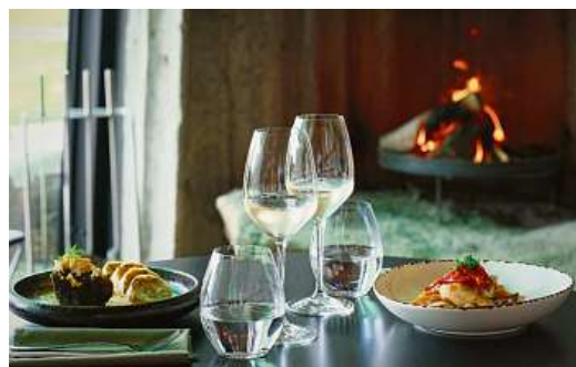
VEČEŘE U KRBU