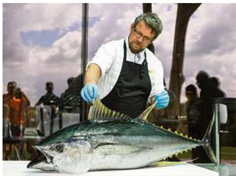
GURMÁNSKÝ VÍKEND - SEAFOOD GRILL / GIN&TONIC BY ŽLUTÁ PONORKA

Celý den probíhá dětská sportovní akademie, kde si děti vyzkouší golf, cyklistiku, jízdu na koních, rybaření a další aktivity v přírodě. Návštěvníkům, kteří u nás tráví celý víkend a účastní se i sobotní degustační večeře nabízíme hlídání dětí do pozdních večerních hodin, starší vyrážejí na noční bojovku, o mladší se stará milá trenérka ve společenské místnosti v penzionu.