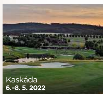
Kaskáda 6.-8. 5. 2022