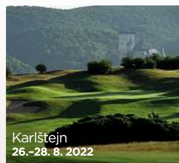
Karlštejn 26.-28. 8. 2022