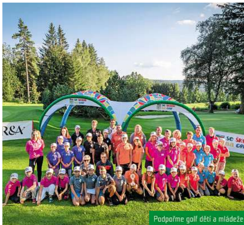
Podpořme golf dětí a mládeže

Díky významné podpoře projektu Se školou na golf, do kterého se zapojuje stále více základních škol, poznaly stovky dětí už v útlém věku