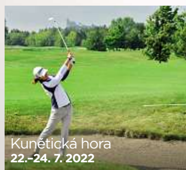
Kunětická hora 22.-24. 7. 2022