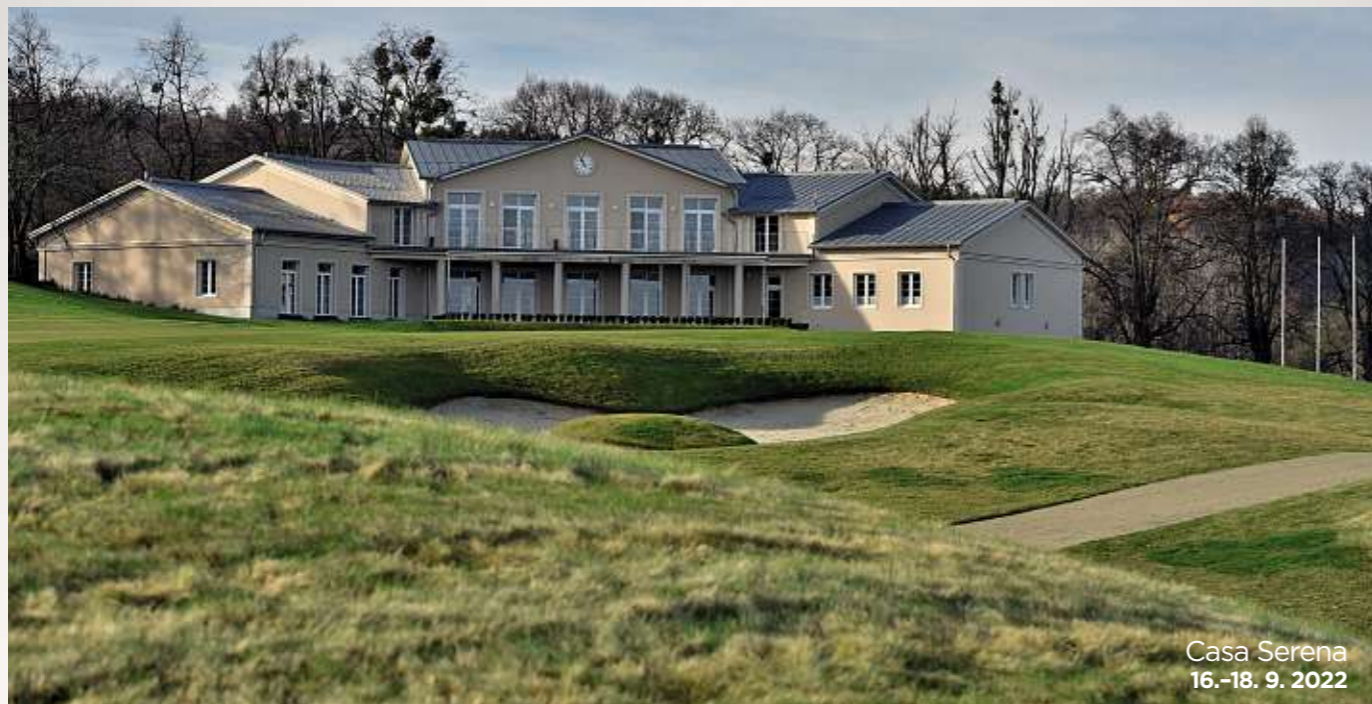
Casa Serena 16.-18. 9. 2022